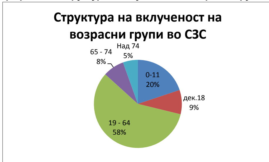
Графикон 1. Структура на вклученост на возрастни групи во СЗС

Доколку ова се разгледа од родов аспект, (Табела 4) ќе се забележи дека од целосно вклучените во возрастната група 19-64 мажите се застапени со 59%, а жените со 41%, но во делумно вклучени, застапеноста на мажите се намалува, а на жените се зголемува до 61%. Значи, според одговорите на испитаниците, повеќе од половина од жените на таа возраст се вклучени делумно во земјоделското стопанисување.